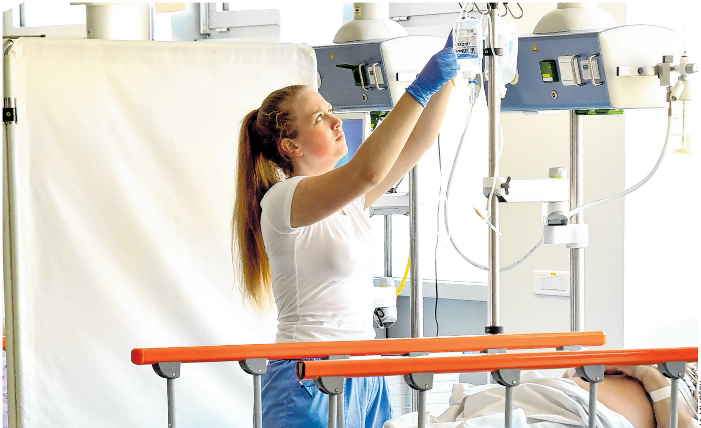
Nakon liječnika, i sestre biraju Hrvatsku umjesto inozemstva

Studenti sestrinstva ne vjeruju da bi im život u inozemstvu bio bitno bolji, a bez obzira na to rade li u Hrvatskoj ili vani, traže jasne uvjete rada, profesionalno priznanje i mogućnost specijalizacije